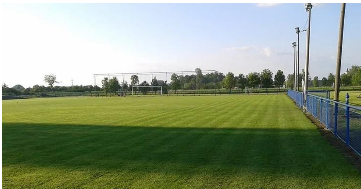
Slika 1. Nogometno igralište „Jelas“ Gundinci

Lokalne jedinice, u propisanim okvirima, samostalno određuju pravila i procedure upravljanja i raspolaganja vlastitom imovinom, odnosno nogometnim stadionima i igralištima. Način, ovlasti, procedure i kriteriji za upravljanje i raspolaganje mogu se utvrditi unutarnjim aktima.