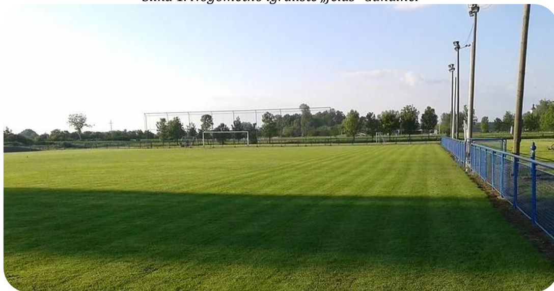
Slika 1. Nogometno igralište „Jelas“ Gundinci

Lokalne jedinice, u propisanim okvirima, samostalno određuju pravila i procedure upravljanja i raspolaganja vlastitom imovinom, odnosno nogometnim stadionima i igralištima. Način, ovlasti, procedure i kriteriji za upravljanje i raspolaganje mogu se utvrditi unutarnjim aktima.